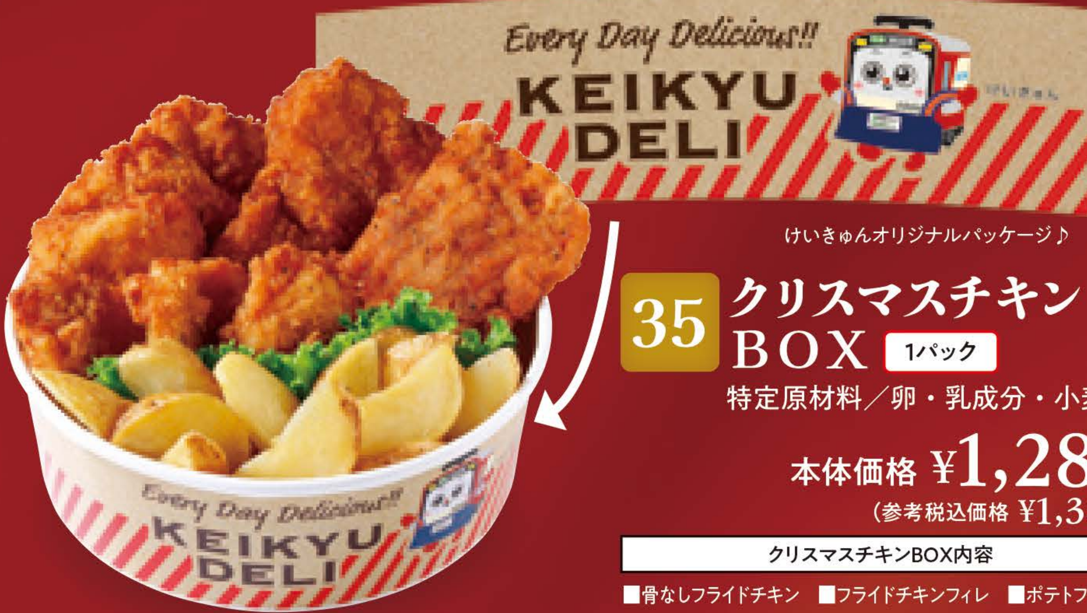
けいきゅんオリジナルパッケージ♪

11月16日(日)までにご予約いただくと 京急プレミアポイント 300Pプレゼント